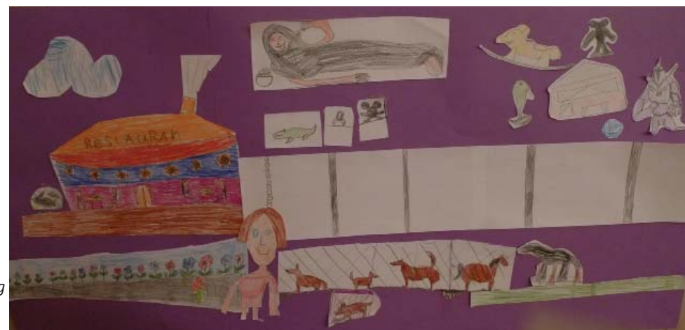
Her vises et forslag til udvikling af møbelhuset. Udarbejdet af børn fra Ilskov Skole