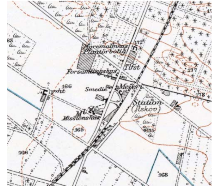
I 1906 da jernbanen kom til, blev der sat skred i udviklingen. Heden blev opdyrket og i takt hermed, blev der bygget flere gårde. Snart var der brug for en købmand, et hotel, et mejeri og en mølle, hvilket betød, at Ilskov by tog form.