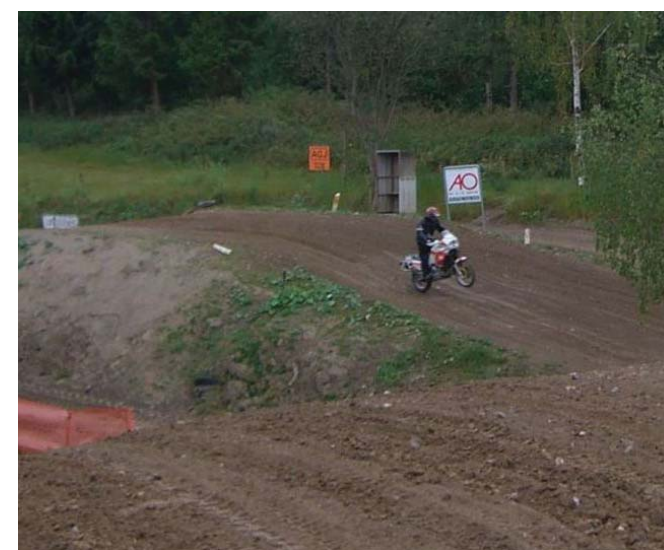
Nye og eksisterende aktiviteter for børn og unge i Ilskov