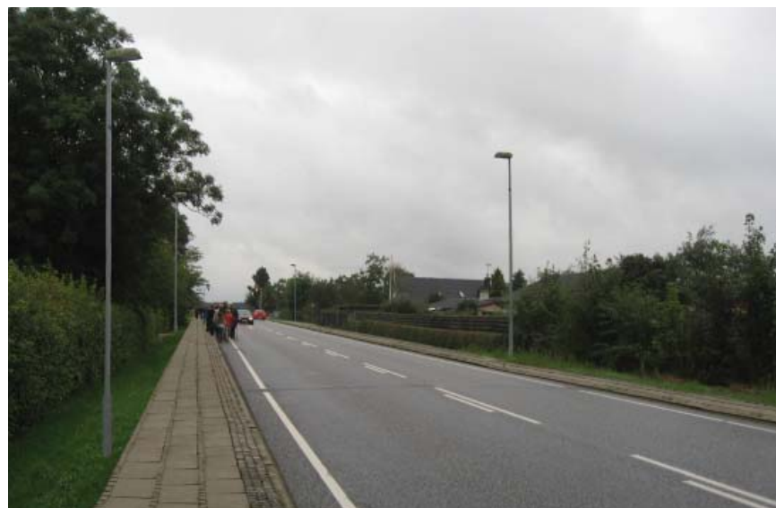
Etablering af fortov og gadebelysning på "Betonvejen" forbedrer trafiksikkerheden og forstærker indtrykket af at færdes i en by.