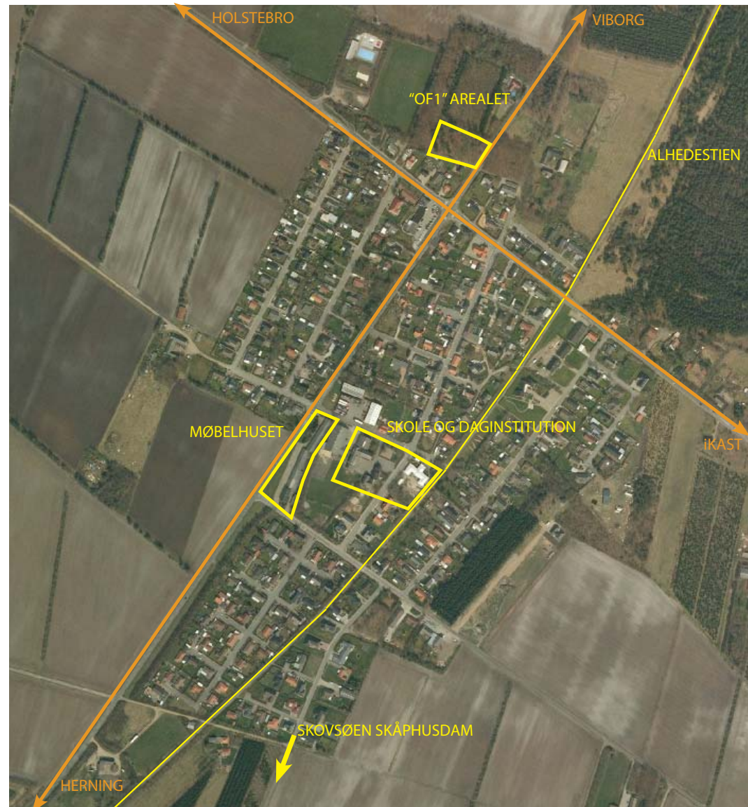
Luftfoto over Ilskov der viser nogle af de områder vi vil arbejde med.

Under hvert indsatsområde ser vi nærmere på, hvordan og med hvilke projekter vi kan realisere vores vision og de værdier, vi ønsker for Ilskov lokalområde i fremtiden.